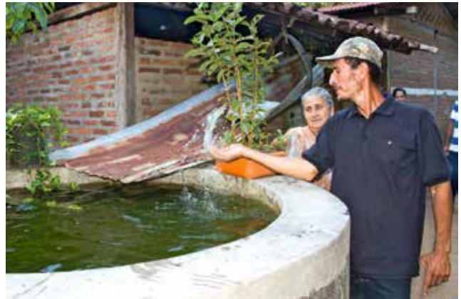
In Nicaragua lernen Kleinbauern, mit der Trockenheit zu leben.

Und mindestens genauso schlimm – der sogenannte „Stille Hunger“. Millionen von Müttern und Kleinkindern haben keine ausgewogene Ernährung: Zu wenig Mineralien, Vitamine, Eiweiß – all das, was ein kleiner Mensch für seine gesunde Entwicklung braucht.